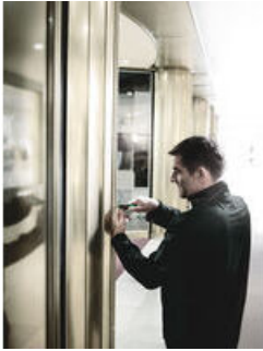
Bits med reducerad skaftdiameter